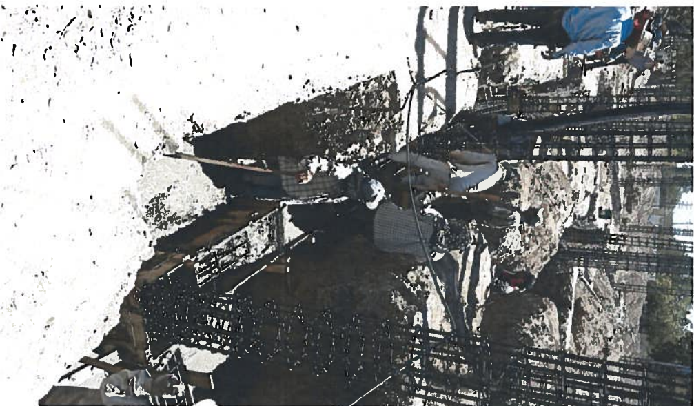
COLADO EN CIMENTACION