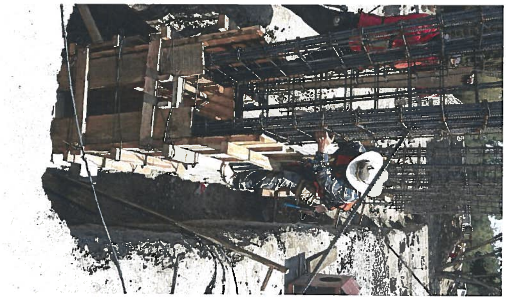
CIMBRA DE DADOS