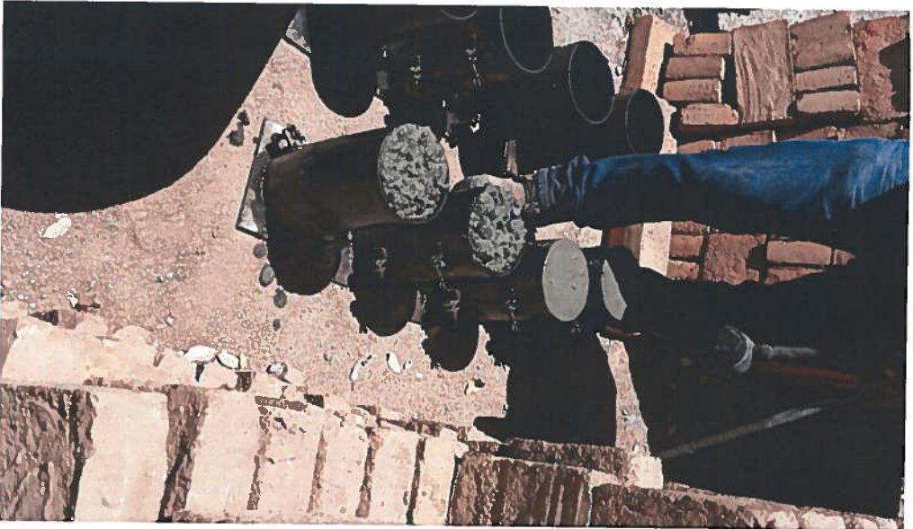
MUESTRAS DE CONCRETO