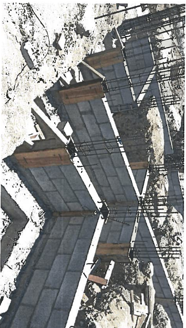
ENRACES DE BLOCK EN CIMENTACION CORNIDA