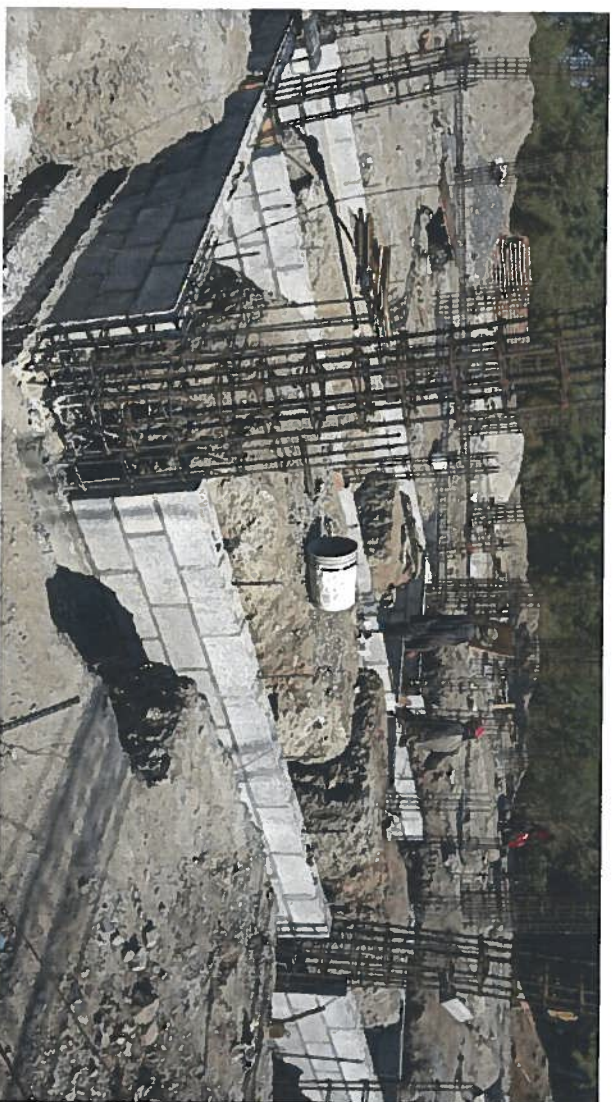
ENRAICES DE BLOCK EN CIMENTACION CORRIDA