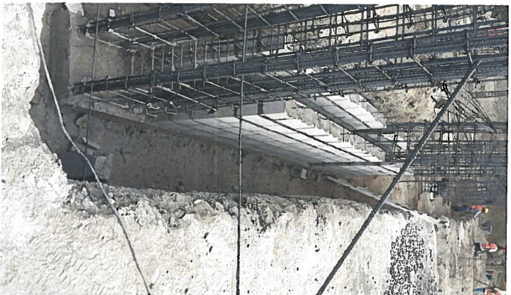
ENRACES DE BLOCK EN CIMENTACION