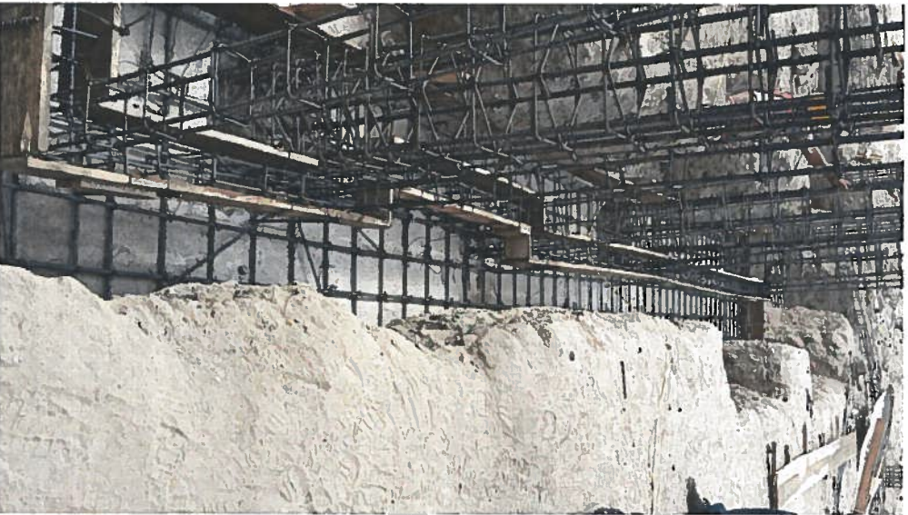
ARMADO Y CIMENTADO DE CIMENTACION CORRIDA