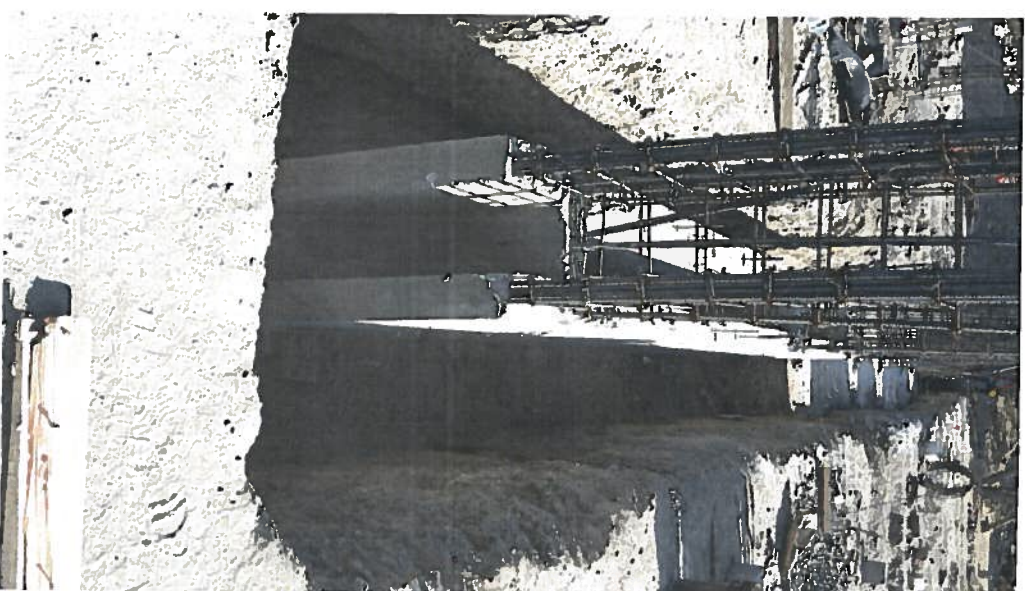
DECIMERA DE DADOS